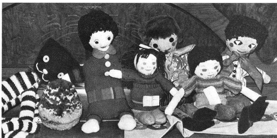
Des poupées pour enfants sages qui, de même que tous les objets confectionnés au cours de l'année, seront vendus dans le cadre de bazars.