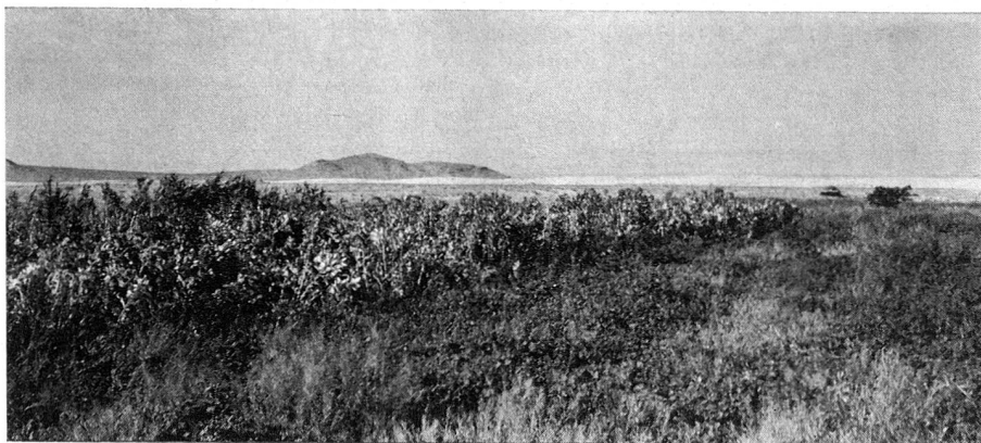
Après la guerre d'indépendance, la guerre contre les sables. Au loin, la ligne blanche: l'ennemi.

Nous ne nous étendrons pas sur eux. Ils sont non seulement ceux qui vont apporter les premiers soins en cas d'accident. Ils sont aussi ceux qui contribuent à l'éducation sanitaire du pays surtout dans les régions excentriques.