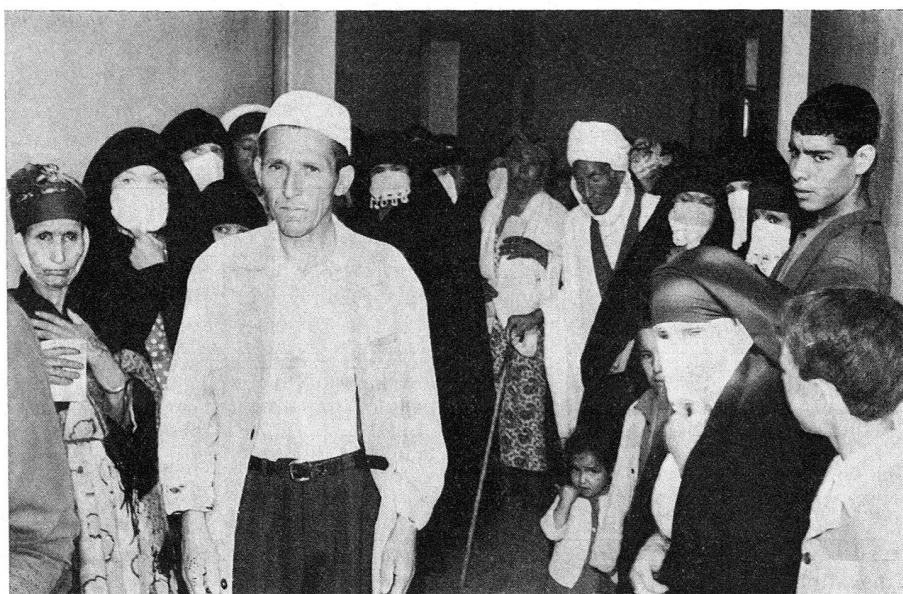
Les dispensaires connaissent l'affluence.

– Les activités sont populaires parce qu'elles plaquent parfaitement avec les besoins et parce qu'elles sont au bénéfice immédiat de la population. En conséquence cette population comme le Gouvernement soutiennent leur Croissant-Rouge de telle sorte que celui-ci peut être d'autant plus actif et efficace.