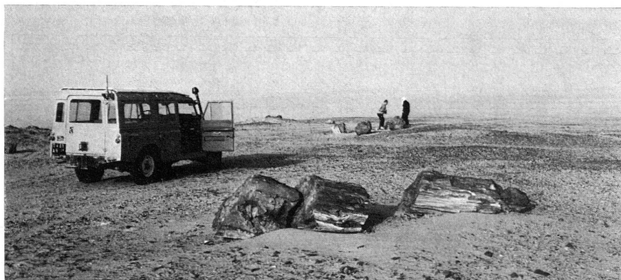
Là, il y avait anciennement une forêt luxuriante avec de grands arbres. Ces restes de troncs pétrifiés en témoignent en plein désert.