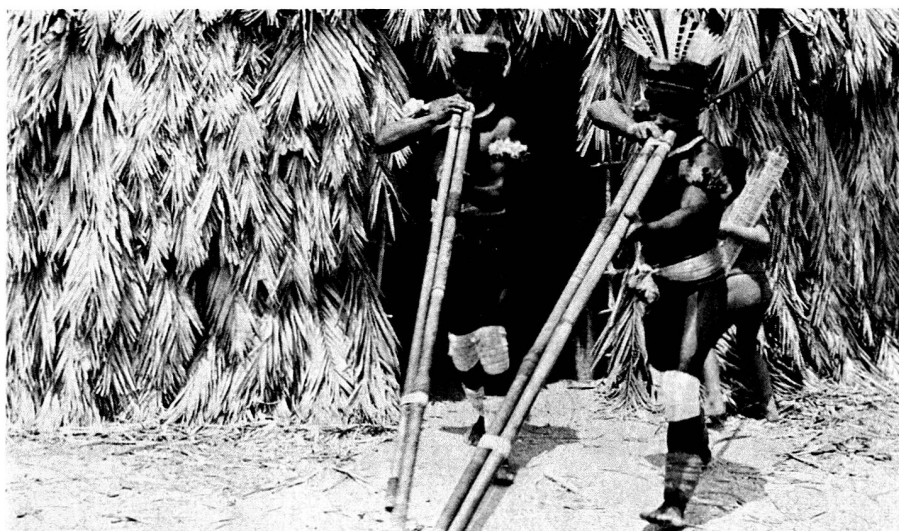
Deux Indiens jouant de la flute double en guise d'exorcisme. A la fin de la saison sèche, avant les semailles, on implore les bons esprits et on conjure les mauvais.

On estime aujourd'hui entre 70 000 et 100 000 le nombre des Indiens qui vivent en Amazonie. Répartis en de très nombreuses tribus, ils habitent des petits villages ou hameaux isolés, parlent des dialectes fort divers et jouissent de niveaux de culture et de civilisation propres très différents. Certains groupes n'ont encore jamais pu être approchés par les blancs; avec d'autres, des contacts se sont établis, souvent d'ailleurs au détriment des Indiens.