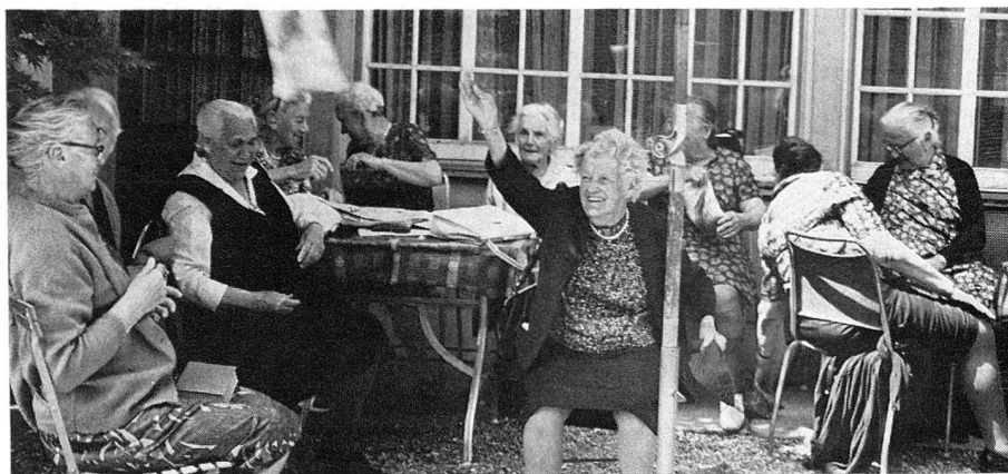
Une bataille de coussins... Oui, mais si ce jeu amuse, il représente aussi un bon exercice corporel!

Bref de quoi faire, en deux semaines, provision de souvenirs ensoleillés qui bientôt peupleront la solitude trop tôt retrouvée.