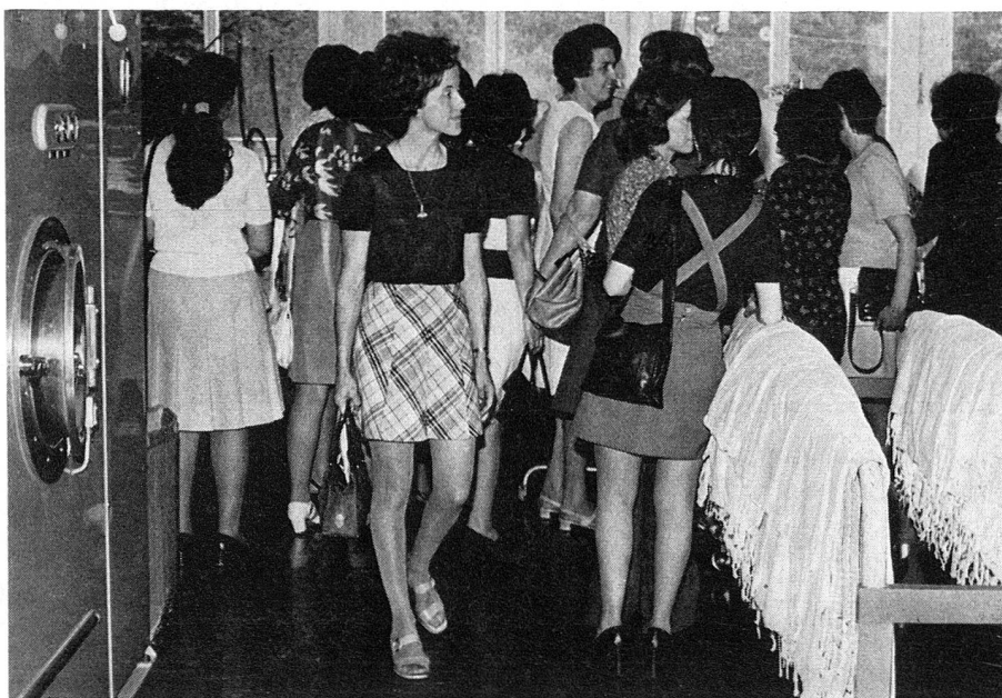
A la Centrale du matériel de la CRS à Wabern, les monitrices tessinoises découvrent les installations modernes de blanchisserie.

Les assortiments fournis pour le cours de «Soins à la mère et à l'enfant», quant à eux, ne comportent que deux caisses chacun; l'an dernier, la Centrale du matériel a procédé à