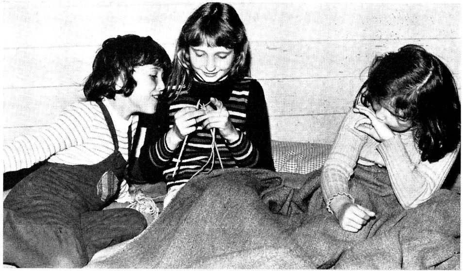
Il ne peut pas faire beau tous les jours... Pour les fillettes, une distraction vite trouvée: le tricot, qui n'empêche pas de bavarder allègrement.