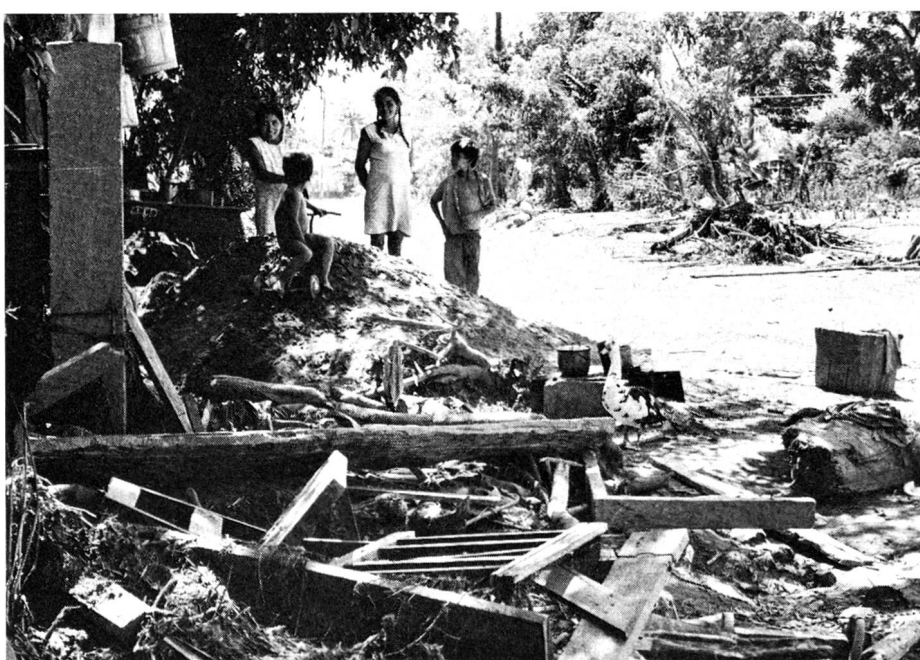
Environ 150000 personnes n'ont plus de toit, plus de travail, aucun moyen de survie... sinon l'aide internationale.

Monsieur Jacques Pilet, journaliste à 24 HEURES, a accompagné l'avion de secours et nous donne ses impressions dans les pages qui suivent.