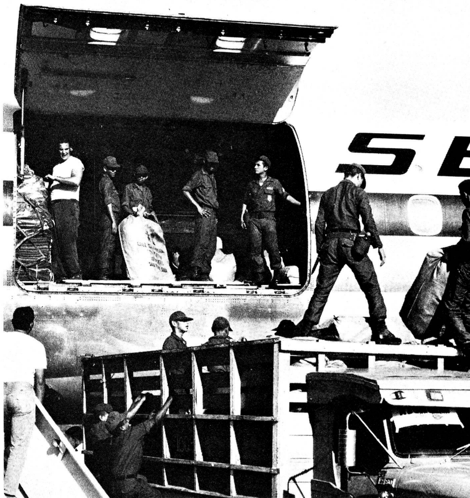
L'avion-cargo affrété par la Croix-Rouge suisse vient d'arriver. Le matériel helvétique est débarqué sous la surveillance de l'armée, mais remis immédiatement aux représentants de la Croix-Rouge hondurienne.

Ce travail se fait à deux échelons. D'abord dans la capitale, Tegucigalpa, où un état-major d'urgence s'est installé dans une école militaire. Puis au niveau des comités régionaux, dans les différents secteurs touchés. Toujours sur la même base: civils et militaires doivent collaborer.