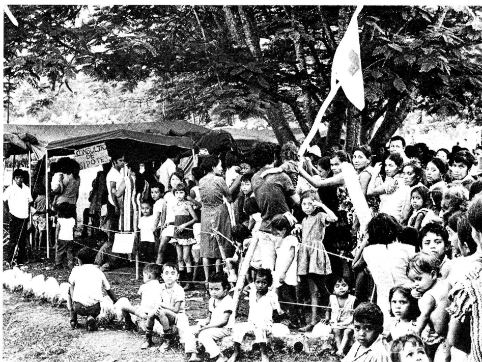
Dans un des grands camps de réfugiés du pays (quatre mille personnes), les malades font la queue devant le dispensaire installé par la Croix-Rouge cubaine.

Etrange climat en vérité... Toutes sortes de tensions naissent du voisinage des organisations d'aide et de l'armée. Mais cette méfiance réciproque a le mérite de rendre très difficiles les accaparements des secours. Ces problèmes ne doivent cependant