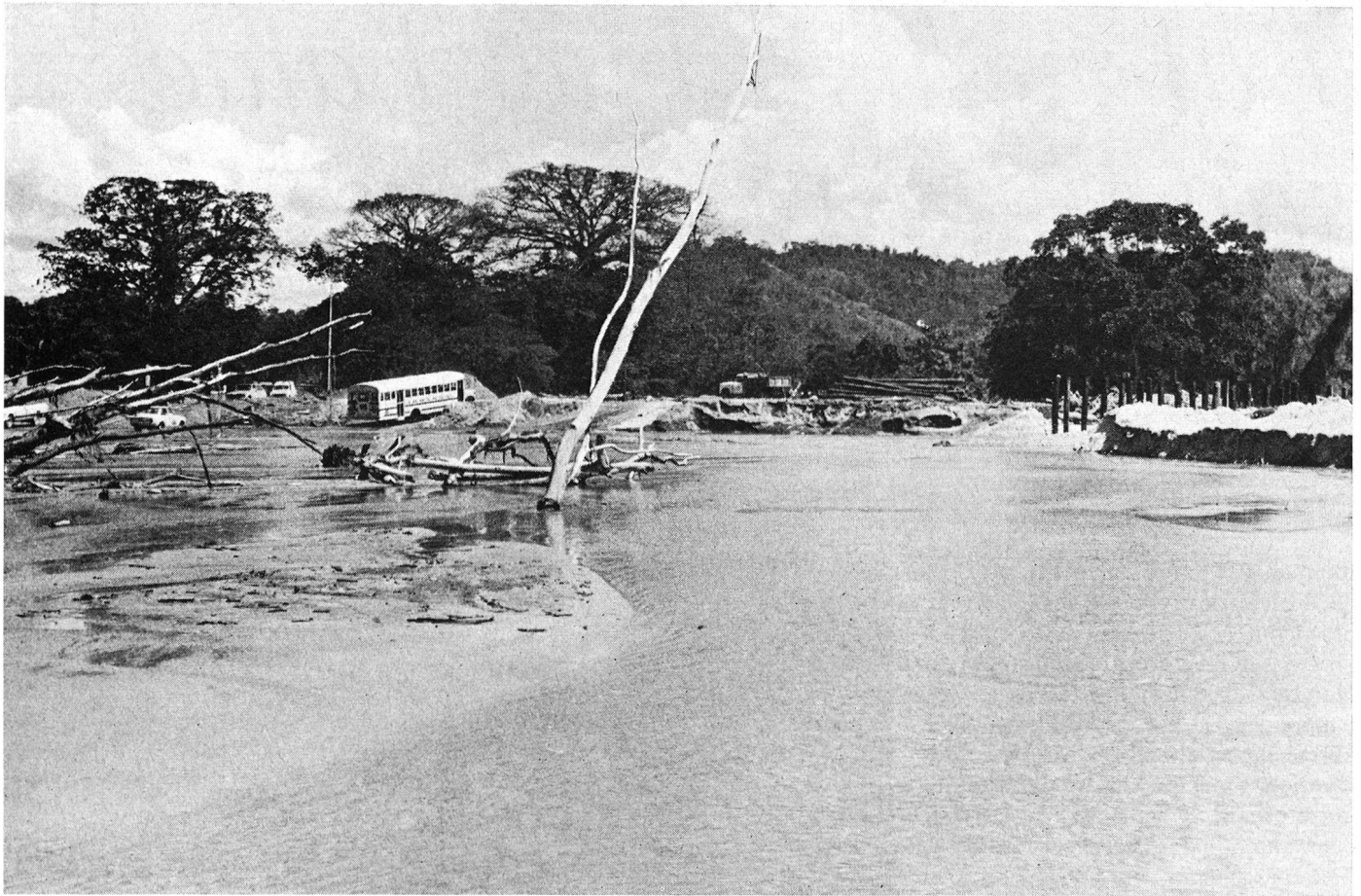
Des dizaines de villages isolés dans des champs inondés, bloqués par des rivières sans ponts... Des dizaines d'autres hameaux tout simplement disparus, ensevelis sous la boue.

A Tegucigalpa, le COPEN (Comité de secours national) réunit les représentants de l'armée, de l'administration et des organisations d'entraide, principalement la Ligue des Croix-Rouges, Caritas et l'Armée du Salut. Des conférences quotidiennes permettent de coordonner les efforts.