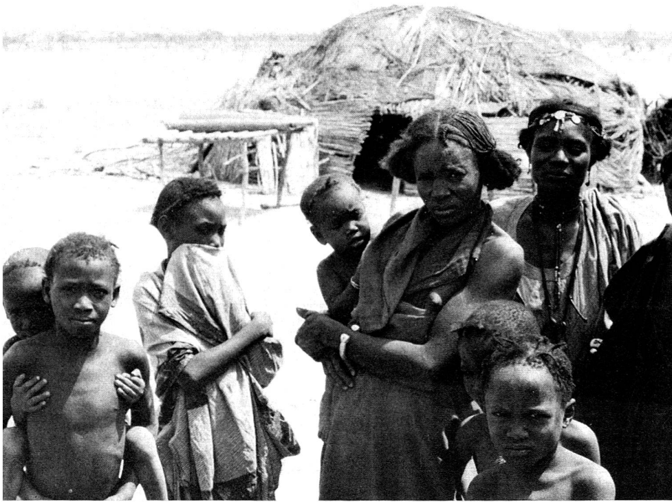
Nella brousse, ancora arida nonostante le piogge di questa estate, i nomadi attendono regolarmente la camionetta delle squadre della Croce Rossa attive nel Niger, che apportano loro viveri, medicinali e consigli.

cioè alle madri incinte e quelle che allattano e ai bambini. Squadre di assistenti della Croce Rossa e collaboratori indigeni operano nei campi di sinistrati a livello alimentare e medico. Alla popolazione, privata della sua nutrizione tradizionale (carne, latte e miglio), essi distribuiscono farina di pesce, olio di soia e cereali per la preparazione della «bouillie», una pappa destinata a garantire un'alimentazione primordiale. Quanto all'assistenza medica, essa tende innanzitutto a combattere le malattie tipiche di quei paesi: colera, malaria, paludismo, nonché a inculcare le più elementari regole igieniche. Ma fino a quando questo programma di assistenza medico-nutrizionalista potrà continuare? Quale sarà il destino di questi sinistrati, in maggioranza nomadi, abituati alle immense solitudini del deserto e della boscaglia, autosufficienti nella loro povertà e da molti mesi ormai dipendenti dall'assistenza internazionale? La preoccupazione dei governanti è la reintroduzione a una vita normale di queste popolazioni sinistrate, alle quali si sono paradossalmente aggiunte, dopo le piogge di questa estate, anche le vittime delle inondazioni. Di non creare bisogni nuovi che in un domani non potranno più essere soddisfatti: i nuovi bisogni potrebbero sorgere da un'assistenza alimentare nuova e gratuita, come quella che si sta attuando ora, che a lungo andare arrischie-