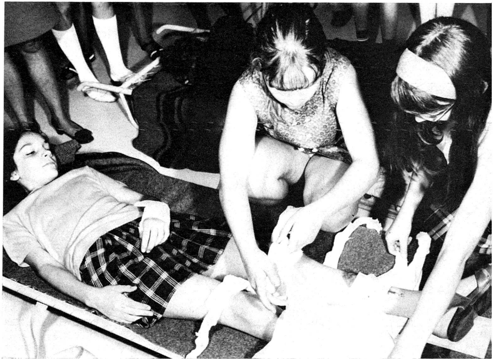
Savoir fabriquer un brancard de fortune avec les moyens du bord.

50 000 personnes, dont bon nombre d'écoliers, ont acquis déjà des notions de secourisme en suivant les cours de sauveteurs que l'Alliance suisse des Samaritains a lancés il y a quelques années.