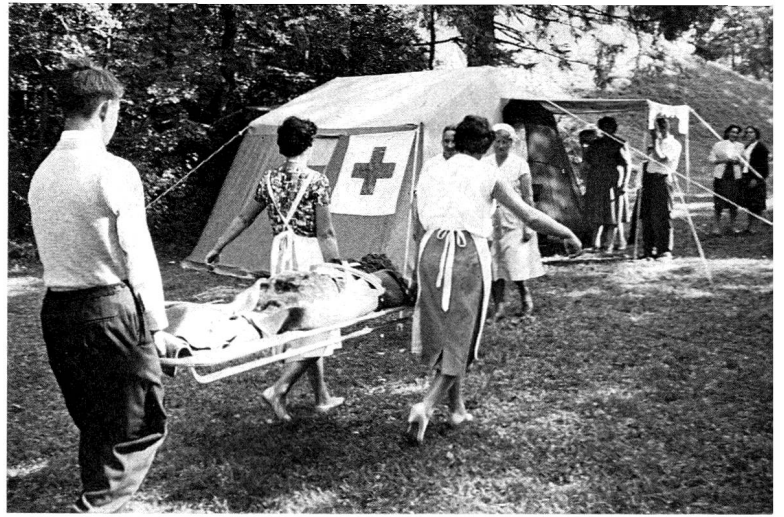
Lors de manifestations publiques, les postes sanitaires desservis par les Samaritains et Samaritaines rendent de très précieux services.

50 000 personnes, dont bon nombre d'écoliers, ont acquis déjà des notions de secourisme en suivant les cours de sauveteurs que l'Alliance suisse des Samaritains a lancés il y a quelques années.