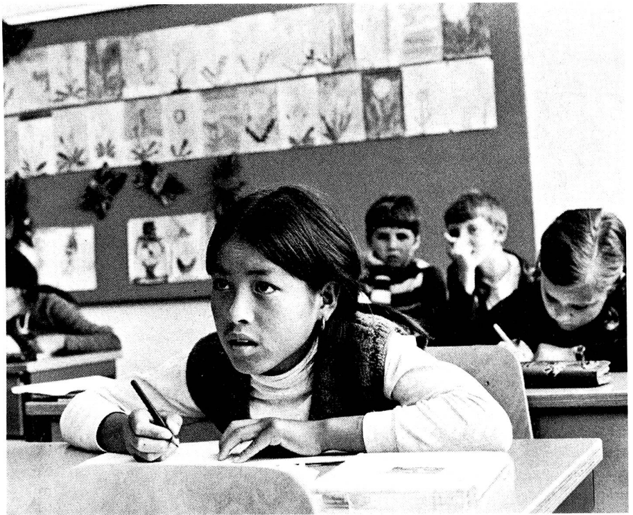
Les enfants fréquentent nos écoles, les adolescents suivent une formation professionnelle conforme à leurs aptitudes...