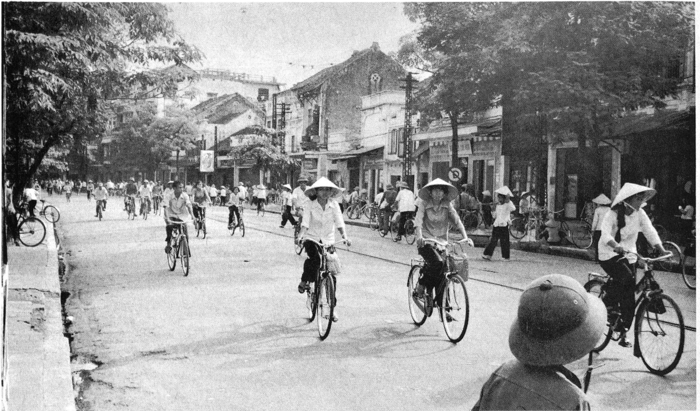
Vue générale de Hanoï dans un ancien quartier français.