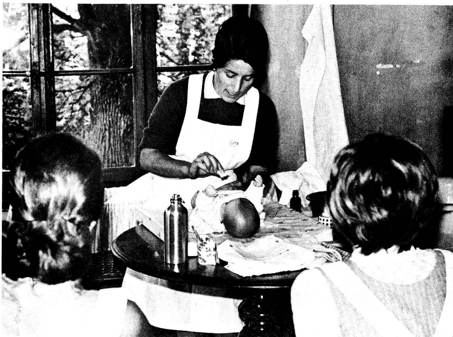
A la ville comme à la campagne le cours de «Soins à la mère et à l'enfant» suscite toujours beaucoup d'intérêt chez les participantes et ... les participants. Nombreux sont en effet les futurs pères qui désirent savoir eux aussi comment soigner bébé!