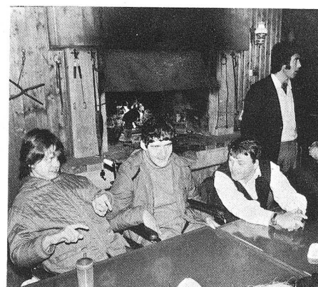
Au milieu du voyage, une petite collation est bienvenue.