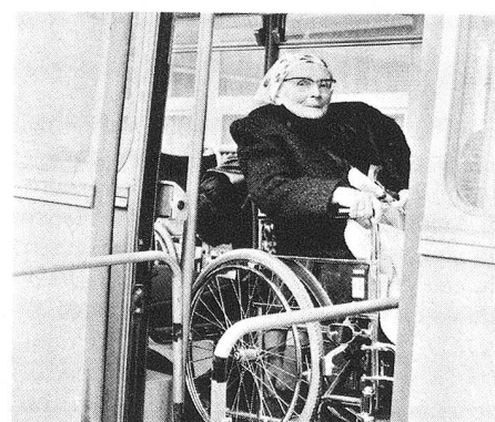
Le sourire timide d'une grand-maman juste avant le départ.