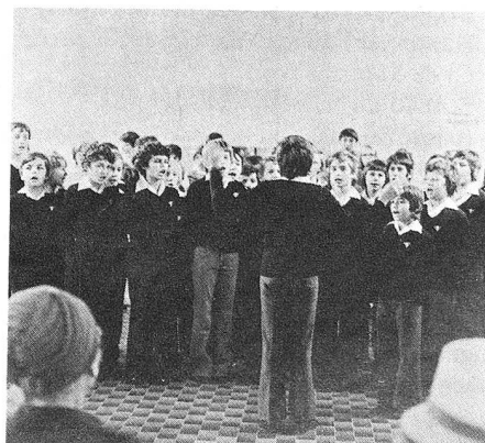
Ce jour-là, les Petits chanteurs à la croix de bois font partie de la fête. Instant émouvant: ils interprètent le «Chant des adieux».