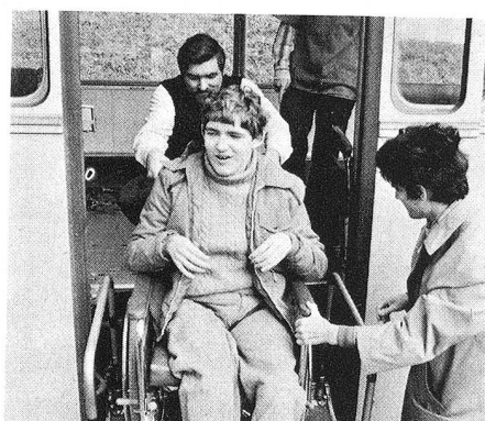
Heureusement qu'il y a un ascenseur pour hisser à bord les chaises roulantes.