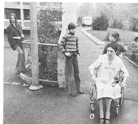
Les jeunes aussi peuvent aider. «Puisque je suis là, je pourrais bien conduire cette dame vers le car.»