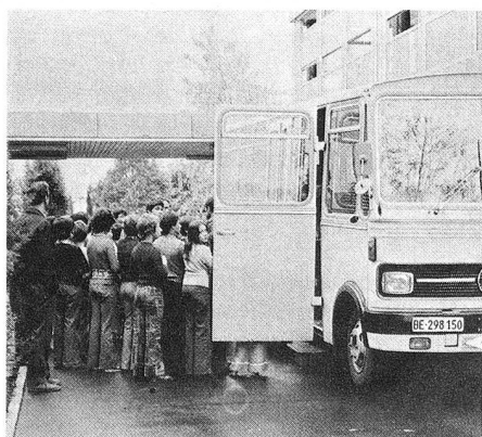
«Le voici... il est là...» Des écoliers se précipitent pour l'accueillir.