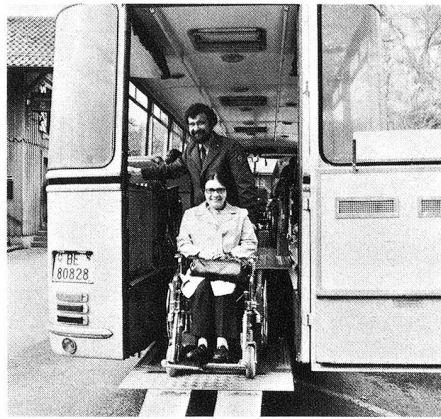
«On est arrivé? Déjà? Dommage! Mais quelle merveilleuse journée...»