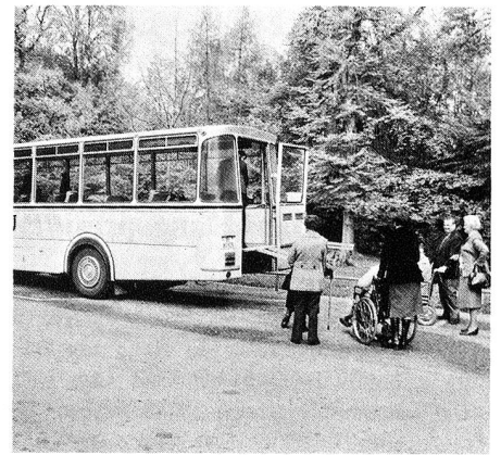
Offerts par les écoliers de notre pays à la Croix-Rouge suisse, les cars continuent leur œuvre humanitaire grâce à votre aide. Merci.