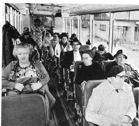
Le grand car peut emmener 23 passagers. Tout le monde est là. En route!