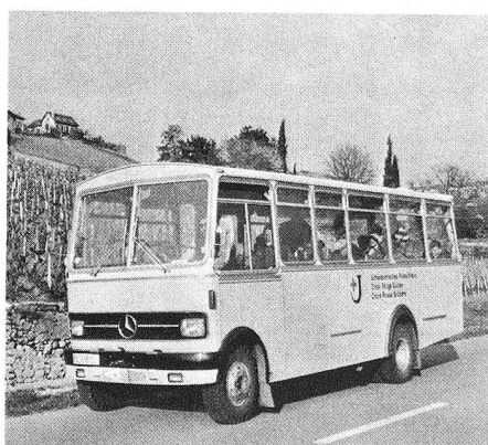
Sur la route de la Côte, vers de nouveaux horizons...