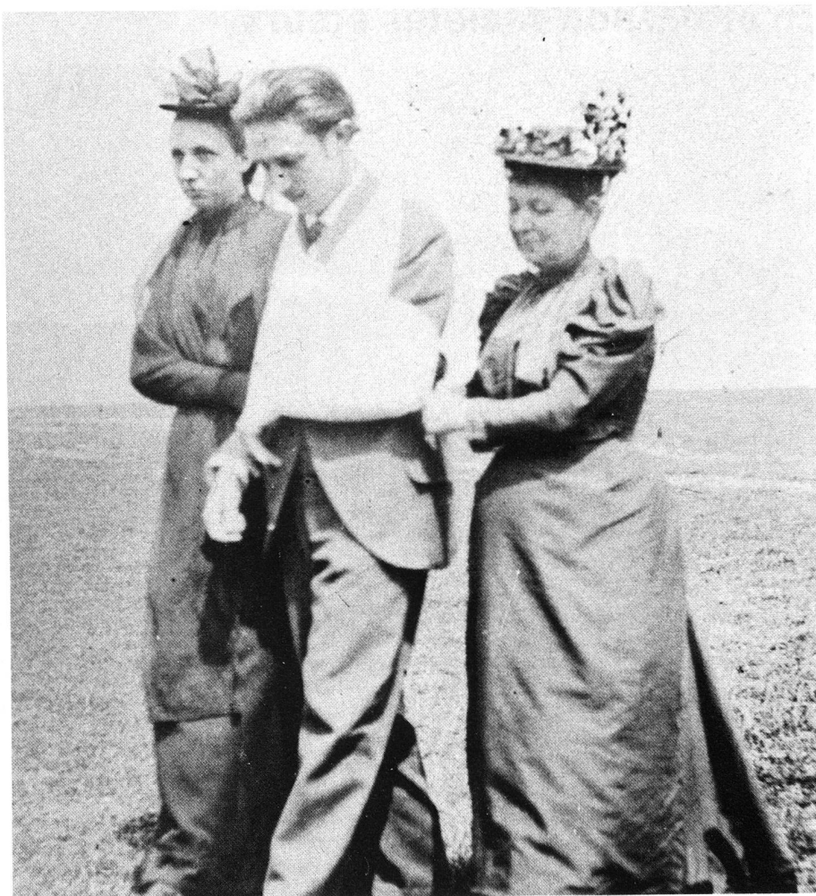
La Belle Epoque. Pas facile le bouche-à-bouche avec ce chapeau.