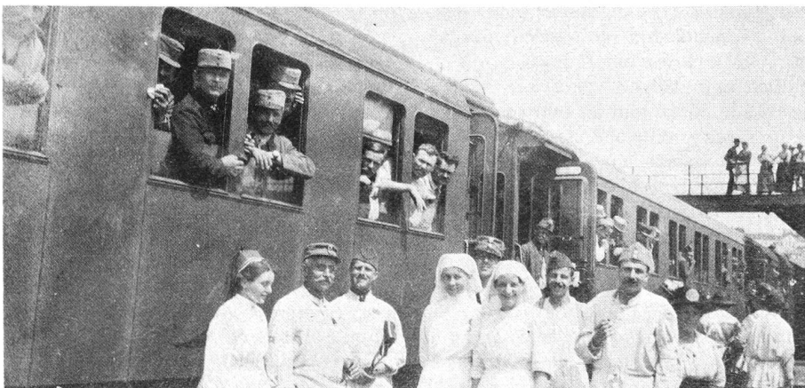
Passage du train en gare de Zurich.