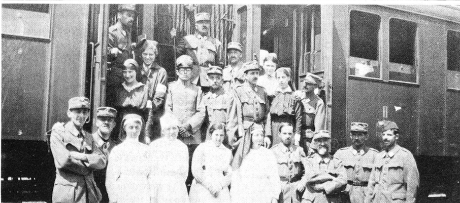
Personnel sanitaire du train Lyon-Feldkirch.