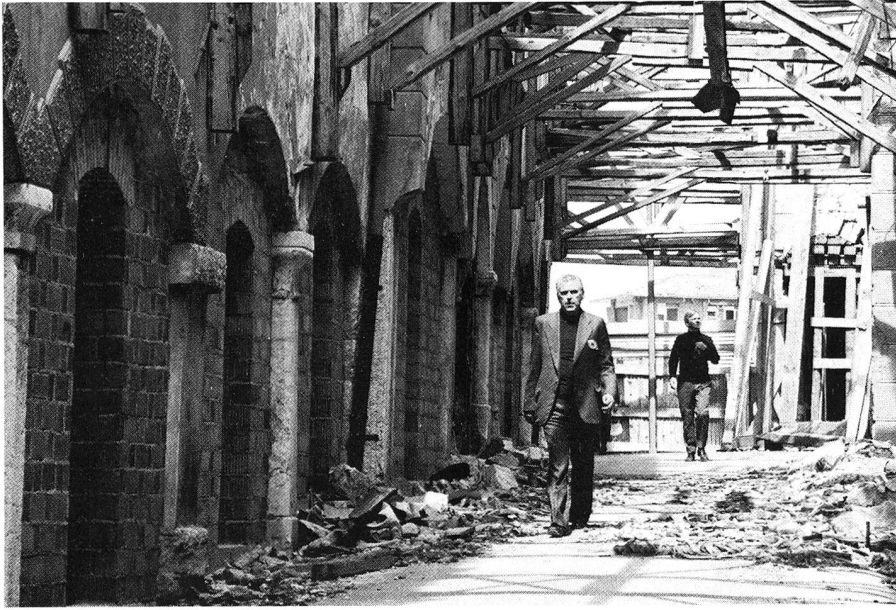
Le secrétaire général de la Croix-Rouge italienne, M. Carlo Ricca, dans les rues désertes de la ville de Gemona entièrement détruite par les deux séismes. Comme dans de nombreuses localités de la région sinistrée, les murs des maisons ont dû être renforcés pour des raisons de sécurité. A Gemona, un bâtiment polyvalent préfabriqué a été monté en un temps record et est utilisé depuis la fin mai 1977 comme salle de réunion et cantine, puis comme salle de gymnastique.