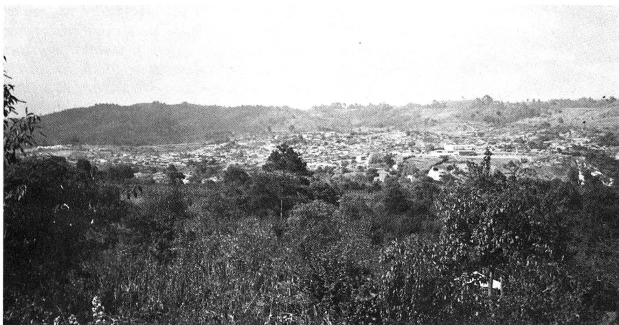
Vue générale de Santiago Sacatepequez, la localité indienne située à 1850 mètres d'altitude sur les hauts plateaux, à 40 kilomètres de la capitale.