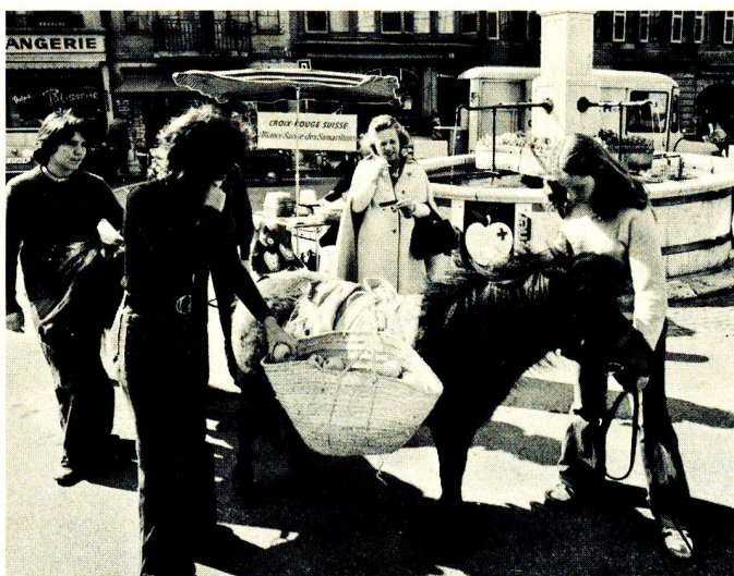
A Genève, des ânonnés venus de la campagne voisine ont participé eux aussi à la vente de pommes...