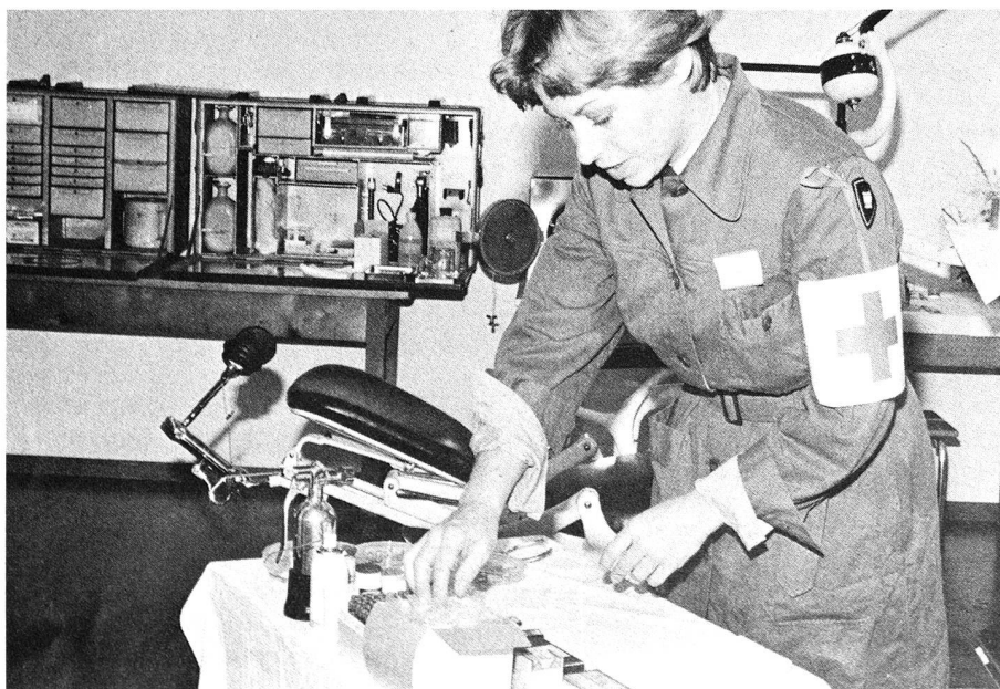
Une aide dentaire procédant aux préparatifs d'un traitement.