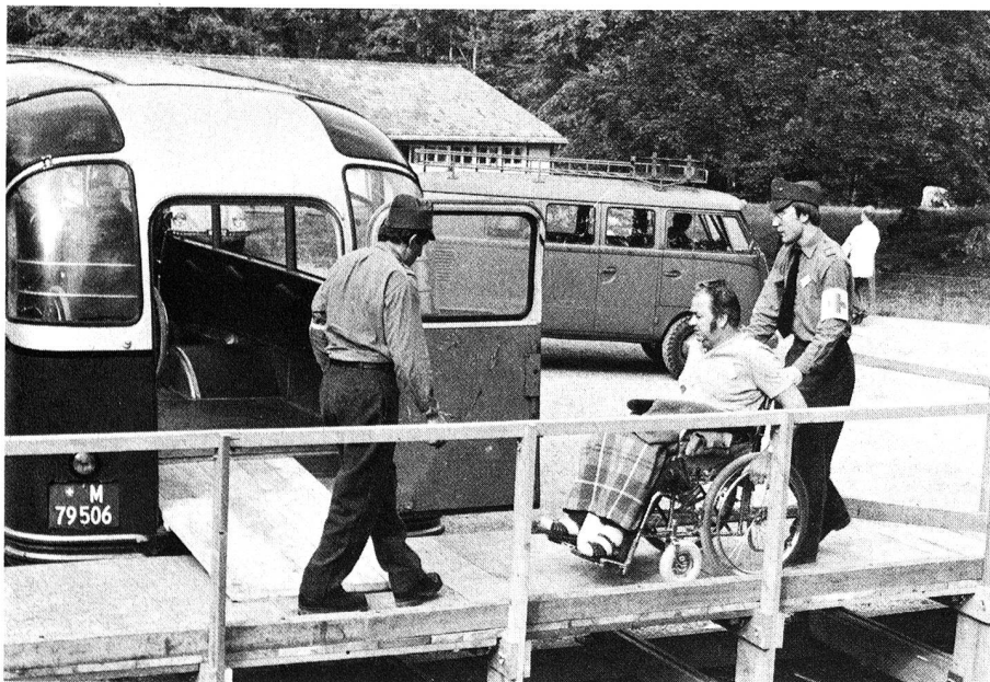
Des rampes spéciales, nouvellement installées, facilitaient le maniement des chaises roulantes.

Pour la troisième fois, l'armée a, au mois de septembre dernier, organisé en collaboration avec la Croix-Rouge suisse et d'autres organisations, un camp de vacances pour handicapés. «C'est mon plus beau service», déclare un appointé qui s'exprime certainement au nom de tous ses camarades; l'organisation a en fait un caractère plus militaire que lors des deux camps précédents, mais le contact avec les invalides représente pour nous un réel enrichissement et nous donne le sentiment de faire vraiment quelque chose d'utile. La satisfaction est beaucoup plus grande