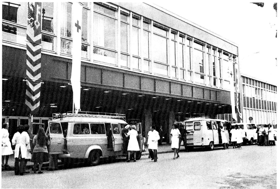
Arrivée des invités d'Henry Dunant au Palais des Expositions.

tout aussi gratuitement à la joie de cette journée. Les frais furent insignifiants. Pour des gens trop souvent cloîtrés, sans joie, sans espoir et sans autre horizon bien souvent que les quatre murs d'une