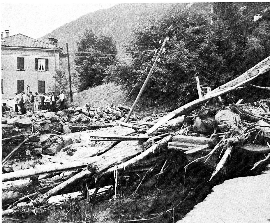
Foto in alto: del ponte che portava ad Aurigeno e Moghegno sono rimasti due monconi. La forza del fiume Maggia, resa ancor più violenta dal materiale alluvionale trasportato, ha causato nella notte tra il 7 e l'8 agosto scorsi danni ingentissimi al patrimonio pubblico e privato. Aurigeno e Moghegno sono ora raggiungibili attraverso un ponte provvisorio costruito dai militari.