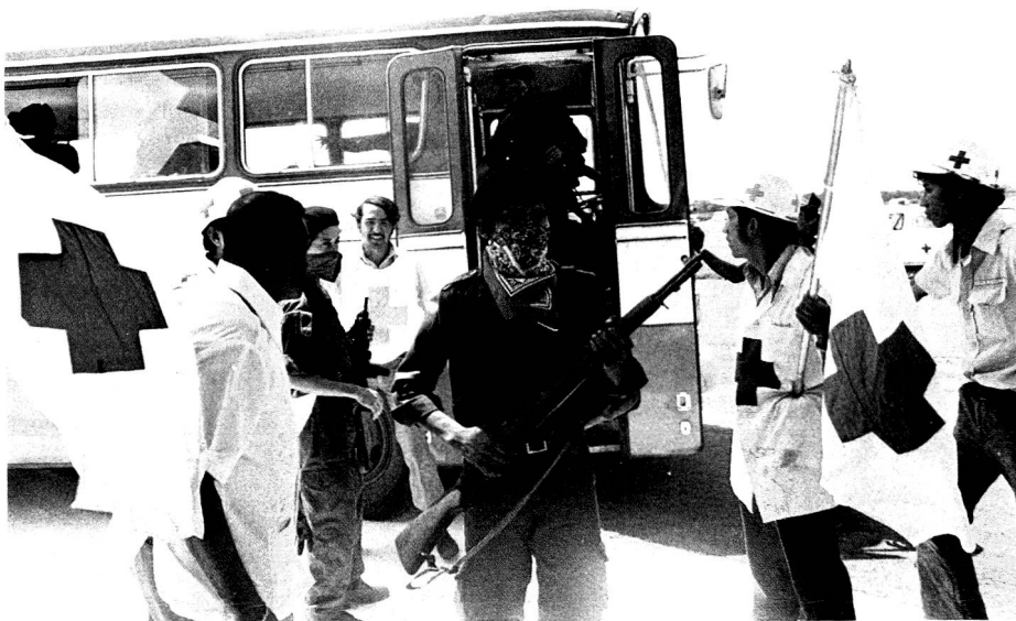
Application pratique des Conventions de Genève: en septembre 1978, lors du siège du Palais National de Managua, qui dura près de 48 heures, les «guérilleros» furent amenés sous escorte de la CR du Nicaragua, à l'aéroport de Managua, avant de prendre l'avion à destination du Panama.