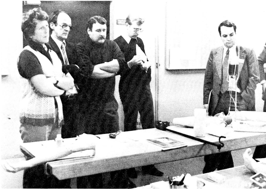
Ce cours, qui s'est déroulé dans les installations de protection civile de l'Allmend, a réuni soixante participants qui sont prêts à assumer des tâches dans le domaine du sauvetage, soit comme instructeurs soit comme conseillers médicaux.

(IAS) et la Commission médicale suisse de premiers secours et de sauvetage (CMSS).