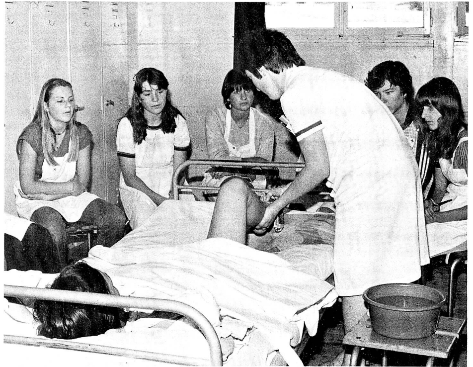
Les jeunes apprennent comment procéder concrètement à certains soins.