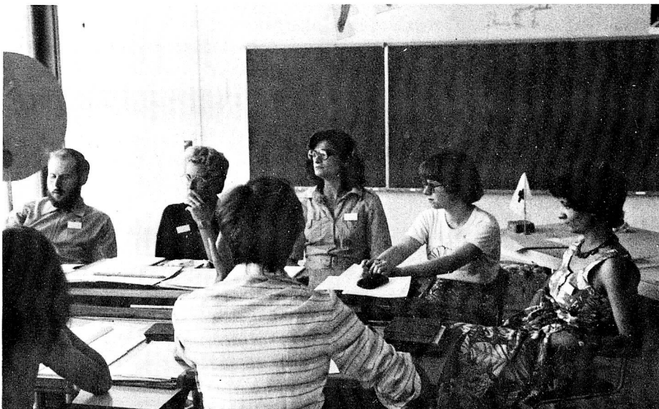
Ce séminaire européen organisé dans le cadre de la Cité des enfants de Saint-Légier a permis aux jeunes participants de se plonger dans la réalité concrète d'une action humanitaire en s'occupant des enfants handicapés de la Cité.