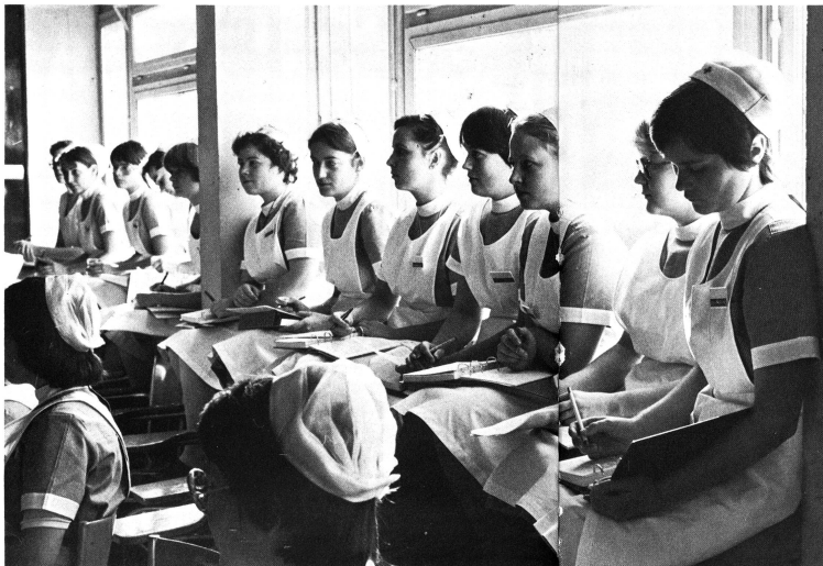
Une salle de cours: comme on le voit, l'uniforme est encore de rigueur! La situation de l'infirmière diplômée n'est cependant pas toujours aussi confortable qu'on le pense: prise en porte-à-faux entre le médecin et l'infirmière-assistante, elle doit actuellement essayer de redéfinir son rôle.

M. B.: Par rapport aux études que j'ai suivies au Bon Secours, elles ont relativement peu changé. On a introduit dans toutes les écoles plus de psychologie, de sciences humaines, de culture générale infirmière mais on fait moins de travail pratique. Peut-être est-ce pour cela que les infirmières aiment moins soigner qu'autrefois. En raison de leur formation théorique plus poussée, il s'est produit un glissement vers le haut qui peut devenir très dangereux étant donné le fait que la Suisse connaît une pléthore de médecins. De son côté, l'infirmière-assistante se présente avec des connaissances suffisantes pour assister le médecin, de sorte que l'infirmière se trouve ainsi placée dans une situation inconfortable. Je suis très inquiète pour l'avenir de l'infirmière, tout au moins en Suisse. Il faudrait œuvrer pour une revalorisation de l'infirmière soignante. L'OMS a publié l'année dernière un rapport sur les soins de santé primaires qui représente l'opinion OMS pour le monde entier à l'heure actuelle. Je n'ai pas trouvé le mot infirmière une seule fois dans ce rapport. On parle d'«agent sanitaire»,