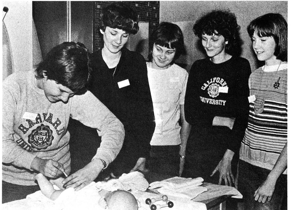
Ces cours de baby-sitting, organisés par les sections de la Croix-Rouge suisse, s'adressent à des adolescents de 14 ans et plus, qui seront ainsi bien préparés à s'occuper des bébés et des petits enfants.