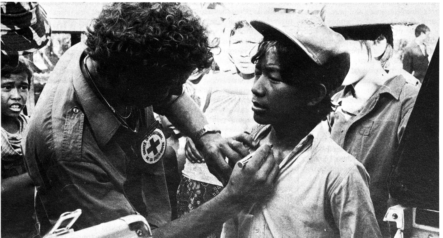
Dans les camps surpeuplés où les conditions sanitaires sont mauvaises, les maladies contagieuses se répandent facilement. C'est la raison pour laquelle le programme antituberculeux mis sur pied par la Croix-Rouge suisse est d'une telle importance.

La Croix-Rouge suisse, avec sa longue expérience des problèmes des réfugiés, se devait de tenter un travail spécifique et essentiel puisque, dans les conditions de surpopulation que connaissent les camps, le risque d'infection est grand. S'il n'est pas possible d'isoler les malades, on va en tout cas tenter de neutraliser leur infection puis de les guérir. Un grand projet. Un grand espoir. C.B.