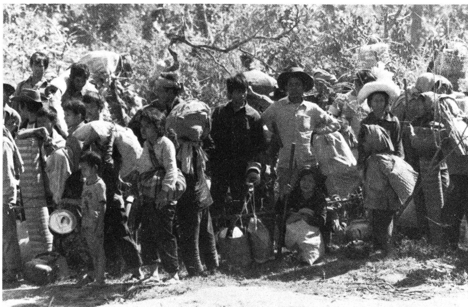
Réfugiés cambodgiens à l'entrée du camp de Nong Samet. Dans un état souvent lamentable, ils attendent d'être accueillis dans le camp où ils pourront être restaurés et soignés.

Les réfugiés khmer libres: Le camp de Khao-I-Dang a été créé à leur intention, mais ils n'étaient que 80 000 à la mi-décembre. Les deux autres camps sont: Nong Samet, avec plus de 200 000 personnes environ, et Mak Mun avec plus de 250 000 personnes, situés tous les deux près de la frontière. Ces deux grands groupes de fuyitifs sont sous le commandement militaire des Khmer Serei (Khmers libres, mouvement anticommuniste).