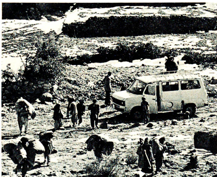
Photo: un transport d'édredons et de couvertures du Croissant-Rouge du Pakistan dans la montagne, jusqu'à un camp de tentes abritant des réfugiés afghans.

Un groupe de membres et de collaborateurs du CICR ont été les hôtes de la CRS, le 22 janvier dernier. Reçus tout d'abord au siège du Secrétariat central, par le président de la CRS, plusieurs membres du Comité central, le médecin-chef de la Croix-Rouge, le secrétaire général et ses deux adjoints, ils ont ensuite visité le Laboratoire central du service de transfusion de sang, puis la Centrale du matériel. Rappelons que le CICR, s'il est international par son champ d'action et son financement, est formé uniquement de citoyens suisses.