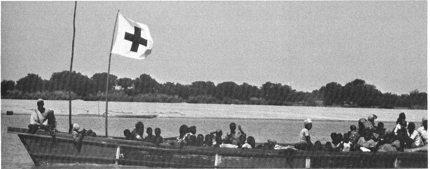
Sous la protection de l'emblème de la Croix-Rouge, le CICR assure l'évacuation ou le rapatriement de victimes de la guerre, en particulier de grands blessés et de malades. Par bateau, le CICR évacue des civils des zones de combat au Tchad sur l'autre rive du fleuve, au Cameroun, où ils seront en sécurité.