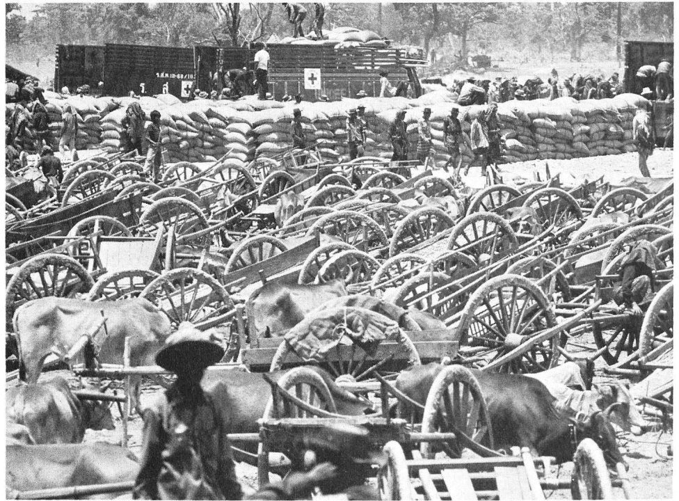
A la frontière thaïe, le CICR distribue des vivres aux Cambodgiens démunis, qui arrivent en chars à bœufs pour ramener les secours à leurs familles

Afin de résoudre un certain nombre de problèmes pratiques, la Croix-Rouge indonésienne a opté pour la décentralisation: des entrepôts autonomes ont été installés dans 23 des 27 provinces du pays et munis de tout ce qui peut être utile en cas de catastrophe, des brancards aux bottes de caoutchouc. Sur le plan local, près d'un millier de volontaires ont reçu une formation portant sur l'entretien des entrepôts et la gestion d'une opération de secours; graduellement, les comités locaux de la Croix-Rouge sont