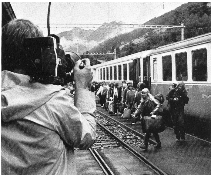
La Lenk, 24 juillet: déjà l'automne?