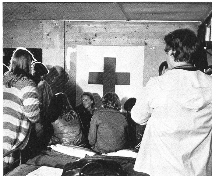
Les premières heures du camp sous les feux des projecteurs.