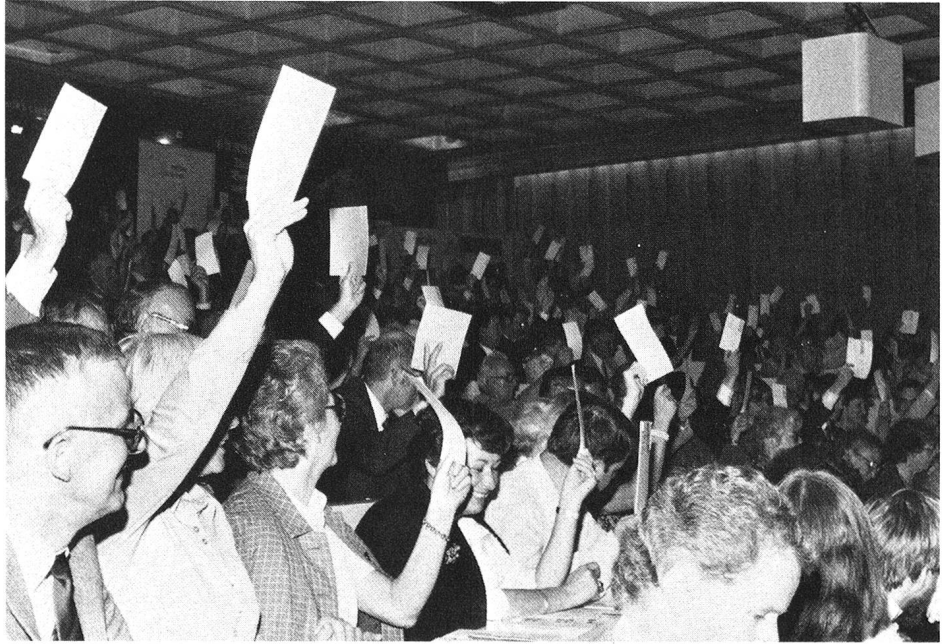
Vote à main levée pour les affaires courantes,

On prévoyait, certes, que cette assemblée, au cours de laquelle devait être élu le nouveau président central de la Croix-Rouge suisse, attirerait un nombreux public, mais la quote des pronostics fut si largement dépassée que l'on dut, en dernière minute, se mettre en quête de locaux de réunion plus vastes que ceux qui avaient initialement été choisis!