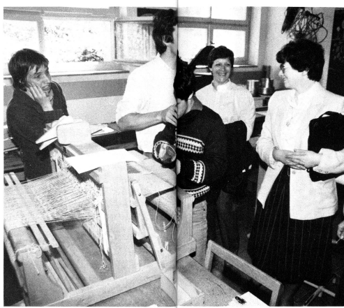
Le handicapé est entouré de ses parents, des responsables du foyer, des maîtres et moniteurs d'ateliers. La

La solidité de l'assurance-invalidité est fondamentale pour tous les citoyens et vitale pour les bénéficiaires des rentes AI. Le financement de l'AI doit être solide et assuré en période de stagnation économique et de démographie stable.