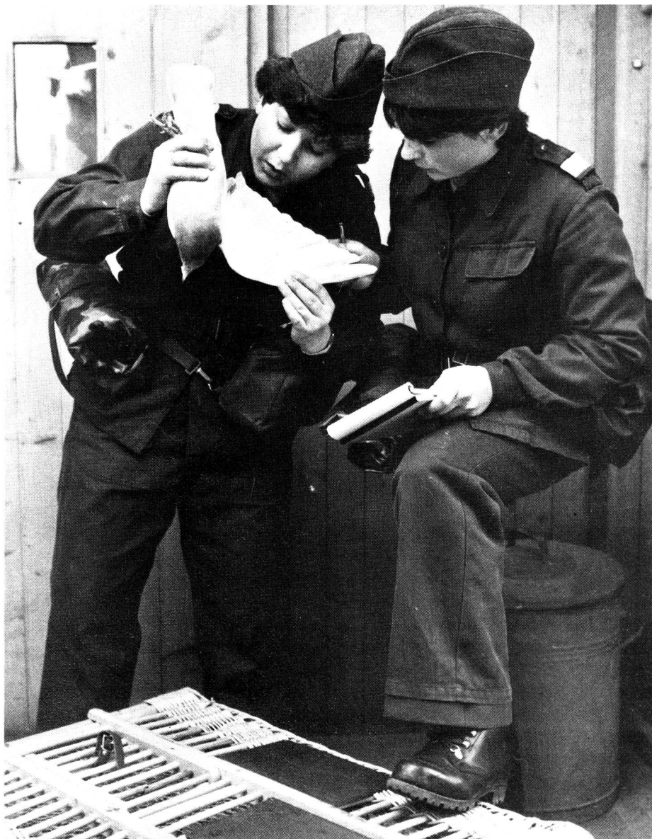
SCF au service des pigeons voyageurs.