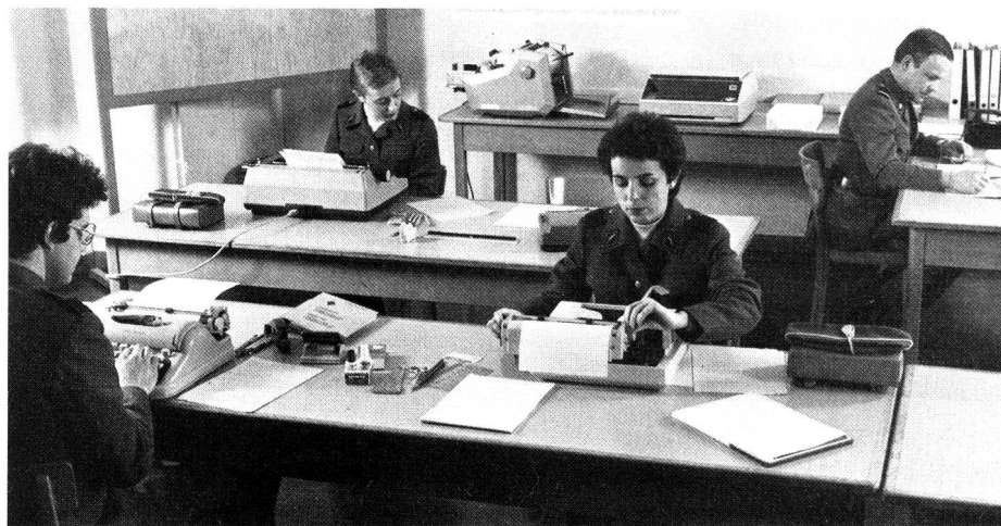
SCF au service administratif.

Organisation militaire de la Confédération suisse, article 20, 3 e et 4 e alinéas (RS 510.10); ordonnance du 9 novembre 1977 concernant le service complémentaire féminin (RS 513.411).