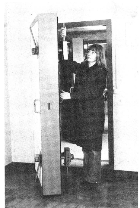
La protection civile affecte les femmes au lieu de leur propre domicile.

◀ Il faut se familiariser avec les installations techniques de l'abri et savoir s'en servir.