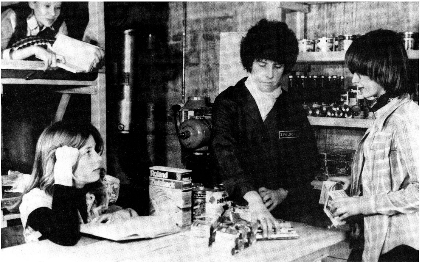
La participation de la femme est quasiment indispensable pour assurer la vie quotidienne dans un abri.

Les femmes, les adolescentes et jeunes gens âgés de 16 ans révolus ainsi que les hommes libérés du service dans la protection civile peuvent s'engager volontairement dans la protection civile. L'engagement volontaire dans la protection civile est généralement contracté pour cinq ans et peut être renouvelé.