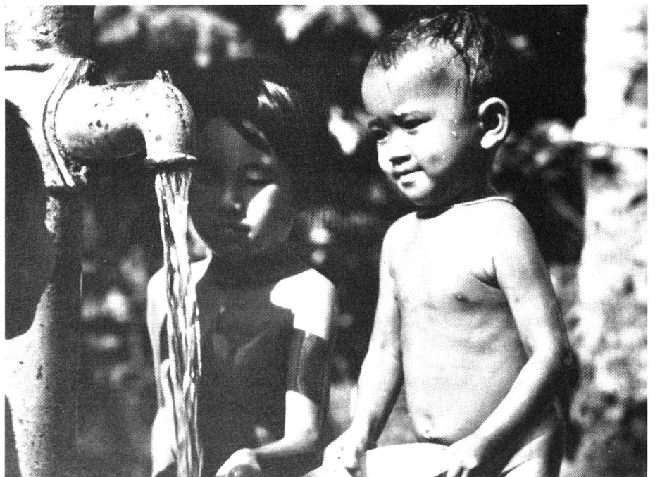
Suffisamment d'eau saine, de bons égouts, permettent d'éviter de nombreuses maladies.