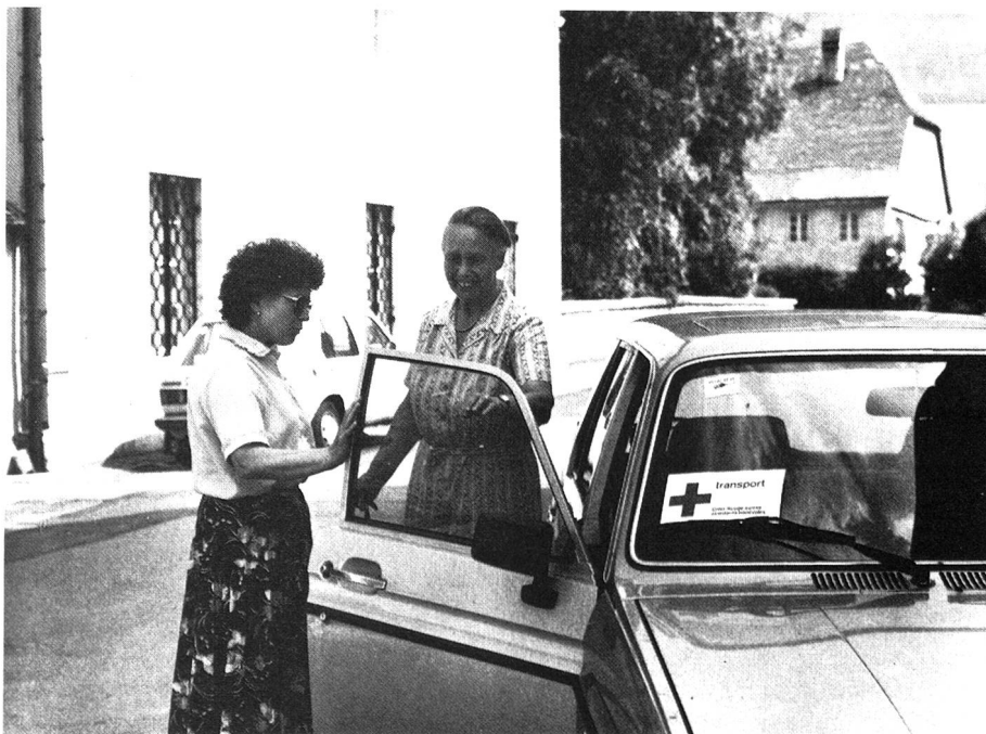
Une assistante bénévole s'apprête à conduire une patiente chez le médecin. On peut voir le panneau Croix-Rouge à l'avant de la voiture; ce panneau est remis à l'assistant bénévole lors de son premier transport.

La mise en place de ce service auto répondait à un véritable besoin dans cette région du Jura bernois et, dès son ouverture, la demande s'est révélée importante, «notamment dans certaines localités mal desservies et décentrées, comme Tramelan par exemple», ajoute M me Guerne. «Mais nous cherchons encore des assistants bénévoles, car le Jura bernois est très étendu et certaines localités ne sont pas représentées, notamment le district de La Neuveville.»