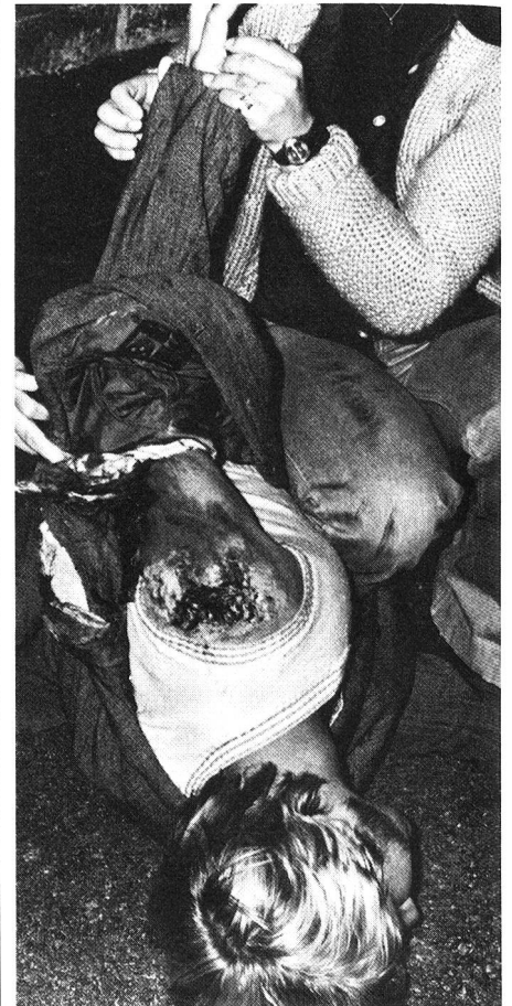
Le secourisme, spécialité des samaritains.

L'équilibre des avantages n'est-il pas l'un des meilleurs ingrédients d'un bon mariage?