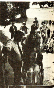
Sensibiliser les jeunes aux problèmes d'autres jeunes. Ici, une rencontre avec des jeunes handicapés.

tré trouve sa vraie raison d'être pour et par les personnes handicapées et non pour servir la cause d'une institution.