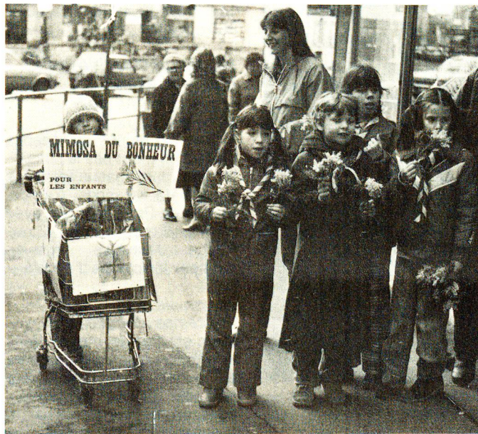
Depuis plus de trente ans, le Mimosa du Bonheur pour l'aide à l'enfance défavorisée.

Situons pour mémoire la fabrication de couvertures pour