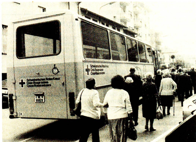
Chiasso, 30 agosto 1984: la sezione del Mendrisiotto della Croce Rossa Svizzera organizza una gita a Pomia (Piemonte) per gli anziani della casa di riposo chiassese.

L'Almanacco è venduto al prezzo di fr. 6.20 e il ricavato viene utilizzato dalla Croce Rossa Svizzera per assolvere i suoi compiti assistenziali su piano nazionale. □