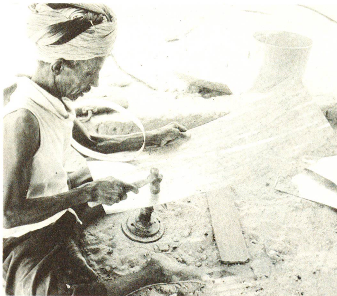
Les nomades deviennent jardiniers. Ils apprennent à fabriquer eux-mêmes des arrosoirs avec les méthodes les plus rudimentaires.

De tels projets doivent permettre aux nomades ayant perdu leur bétail, et donc leur patrimoine originel et leur gagne-pain, de continuer à vivre dans leur patrie et contribuer ainsi à freiner l'exode rural. Sous la conduite de spécialistes du Croissant-Rouge, les