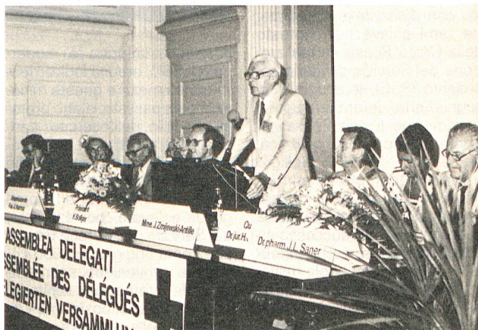
Locarno, 15-16 giugno 1985: tavolo presidenziale della 100ª Assemblée dei delegati della CRS.

Con un aperitivo servito al Castello visconteo si è chiuso questo centesimo appuntamento Croce Rossa, che ha visto riuniti nella perla del Verbano circa 300 delegati in rappresentanza delle 69 sezioni regionali della Croce Rossa Svizzera. □