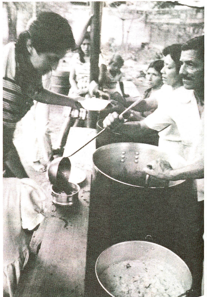
Distribution de nourriture dans le camp de Lériida.

Dès l'annonce de la catastrophe, la Croix-Rouge suisse a envoyé sur place 1000 tentes, destinées à l'hébergement des rescapés. Actuellement, la Croix-Rouge suisse procède à l'évaluation des projets possibles de reconstruction et de réhabilitation, pouvant contribuer à une amélioration structurelle à long terme.