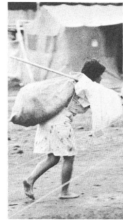
Le camp de Guayabal: des conditions de vie difficiles.

La Croix-Rouge colombienne offre quatre types d'assistance de base: logement, nourriture, santé et occupa-