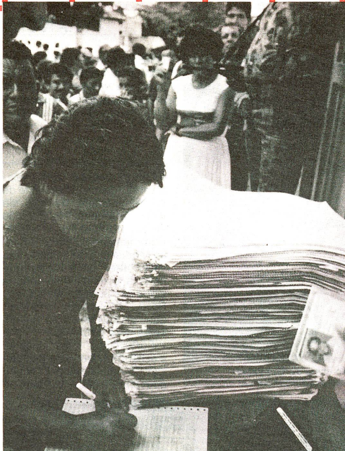
Pour de nombreuses victimes dans l'attente d'une solution, l'impatience et l'amertume des rescapés...

des sociétés de la Croix-Rouge à Genève, d'autre part, peut fournir un total de 4 millions de dollars pour des projets de reconstruction. Toute l'assistance fournie jusqu'à présent aux 10 000 sinistrés l'a été au titre de l'aide internationale.