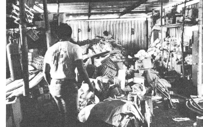
Hangar du camp de Cambao: «Nous n'étions pas préparés pour faire face à une telle catastrophe.»

Sur place, les esprits s'échauffent quelque peu devant le retard pris par l'action gouvernementale. Le délai de