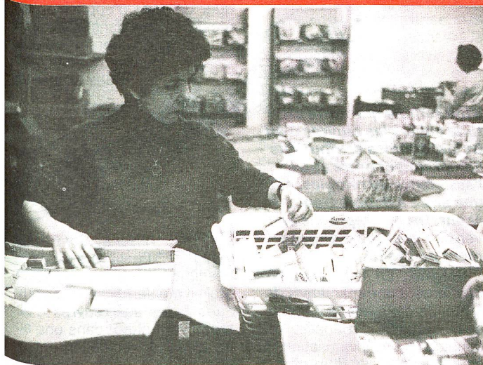
Le délicat travail de l'emballage. La composition des colis varie suivant le destinataire.