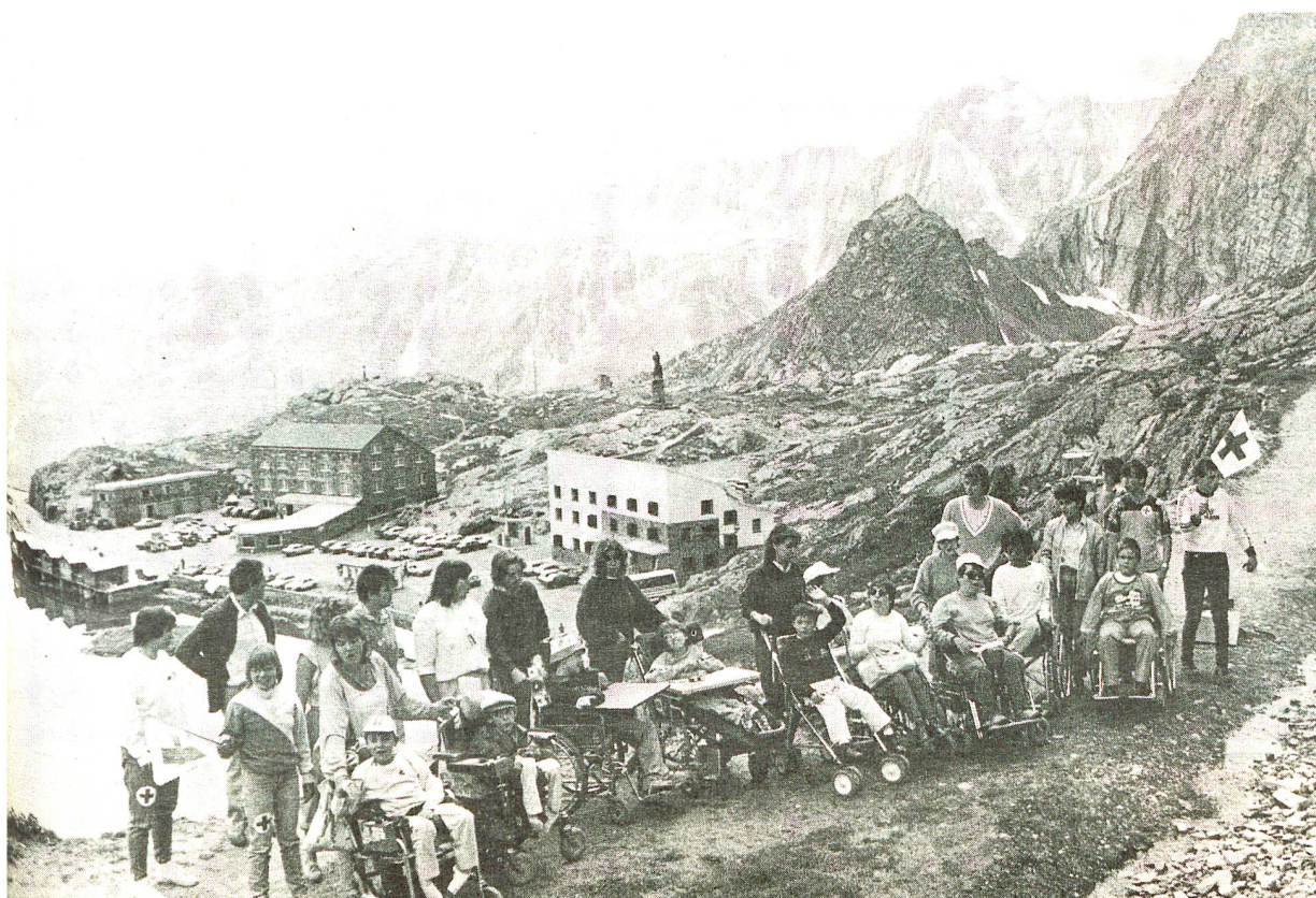
Les participants au grand complet au sommet du col du Grand-St-Bernard.

Renseignements: Secrétariat romand de la Croix-Rouge jeunesse, Tivoli 60, 1007 Lausanne