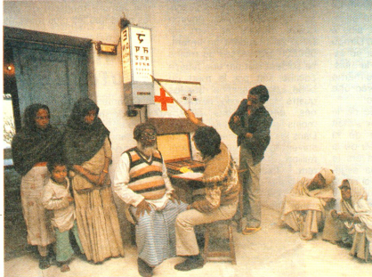
Vue de la salle de consultation de l'hôpital de Népalganj.

Le projet de la CRS au Népal est financé en grande partie par le produit de la campagne de récupération de l'or dentaire, le reste par la Confédération L'action vieil or, qui a démarré en 1977 déjà, est due à l'initiative d'un médecin-dentiste de Weinfelden (TG), le Dr Schatzberger, qui est aujourd'hui retraité (voir «Actio» 4.87). Les patients contraints de remplacer une couronne en or peuvent faire parvenir les déchets à la CRS au moyen d'une enveloppe jaune spécialement prévue à cet effet et disponible dans la plupart des cabinets dentaires. Au cours de la seule année 1985, la CRS a collecté de cette manière 13,6 kg de vieil or, pour une valeur démentie tout au long des ans, surtout en Suisse allemande. La poursuite du projet de médecine ophtalmologique dépend toutefois du soutien des donateurs, en l'occurrence des médecins-dentistes qui attirent l'attention de leurs patients sur la possibilité de faire un don.