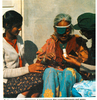
Patiente en convalescence. L'assistance des convalescents est assurée par des bénévoles de la Croix-Rouge jeunesse népalaise, qui veillent également à ce que les opérés suivent leur traitement post-opératoire.