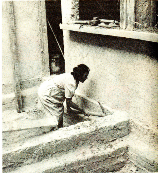
L'enfant sera bientôt là: il faut qu'il ait un toit.

Dans ce mouvement, la participation des femmes a été fondamentale: ce sont elles, avant tout, qui ont pris en main la réorganisation de la vie quotidienne. Au prix d'efforts extraordinaires, elles ont pu dépasser leur choc émotionnel et affronter de fait une nouvelle réalité. Et c'est cette expérience qui leur a permis de prendre conscience de tout le potentiel qu'elles avaient en elles.