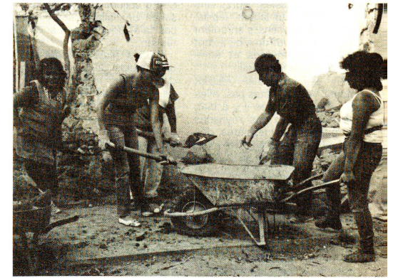
Un professionnel montre comment il faut faire. Les femmes s'y mettent avec entrain.

«Je suis responsable de la Commission des finances. Mon travail consiste à récolter l'argent dont nous avons besoin pour les dépenses telles que l'entretien. L'argent provient des cotisations que payent les habitants de chaque quartier; nous organisons des loteries, des tombolas, des kermesses, etc. Comme vous le voyez, cette tâche est délicate (Suite en page 23)