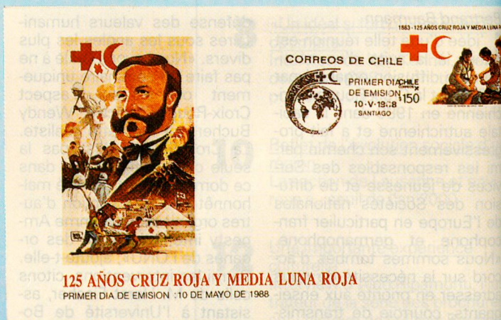
Timbre émis par les postes chiliennes à 200 000 exemplaires. Lors de la cérémonie marquant le premier jour de l'émission, «le rôle culturel du timbre en faveur de grandes causes humanitaires» a été souligné.