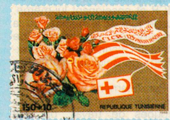
Un bouquet d'anniversaire des postes tunisiennes pour le 125ème anniversaire du CICR.

(les timbres et enveloppes de premier jour reproduites ci-dessus nous ont été aimablement fournies par la Ligue des Sociétés de la Croix-Rouge et du Croissant-Rouge)