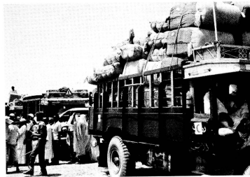
Distribution de couvertures en laine aux sinistrés. Une telle opération se fait toujours dans une atmosphère tendue. Pour éviter que la situation n'échappe à tout contrôle, une organisation irréprochable et un travail efficace et consciencieux sont indispensables.

rité ni pour les troupes gouvernementales ni pour les combattants de la liberté, même une organisation humanitaire comme le Comité international de la Croix-Rouge (CICR), dont le rôle est pourtant de défendre les populations civiles dans les régions en conflit, et qui a une grande expérience dans ce domaine, n'a réussi à ce jour qu'à rassembler du personnel et du matériel (vivres et avions notamment) sans pouvoir encore aller plus loin. Les négociations sont longues et pénibles. Jour après jour, les efforts se multiplient pour parvenir à un accord qui permettrait la distribution de vivres aux populations affamées dans le sud du pays.