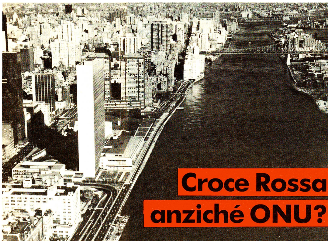
Il palazzo dell'ONU a New York: «small is beautiful».