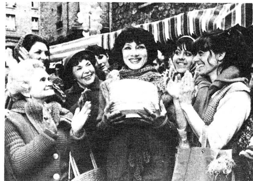
La presenza dell'aiuto domiciliare è sempre apprezzata.

ne di determinati lavori a istituzioni che a loro volta ricorrono alle risorse e alle capacità degli handicappati, consentendo loro una certa autonomia. Oppure avvicinando i responsabili dei numerosi gruppi che incoraggiano lo sport per handicappati, assistere alle loro gare e assegnare eventuali premi ai partecipanti. Invito pure le persone in buona salute a rendere semplicemente visita agli ammalati e ai pazienti cronici curati a domicilio o all'ospedale, al fine di interrompere il loro isolamento, di ascoltarli e di dimostrare a ciascuno di loro che la sorte che li accomuna non ci lascia indifferenti e che noi ammiriamo e incoraggiamo gli sforzi che essi fanno per accettare la loro condizione e i tentativi per reinserirsi nella vita di ogni giorno.» □