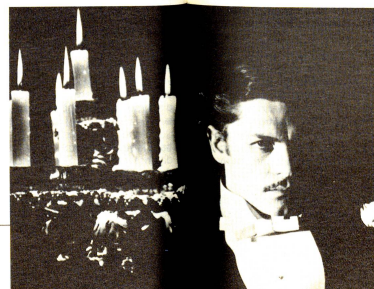
Per secoli e secoli l'uomo di scienza ha cercato di capire il preciso ruolo del sangue alla luce delle candele.

Michel Servet, medico spagnolo che, perseguito dall'inquisizione, riparò a Ginevra (1509-1553), scoprì che la circolazione polmonare permette al sangue venoso di purificarsi e di ossigenarsi nei polmoni.