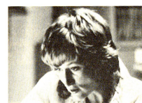
Dalle candele al computer abbiamo perso il senso della fantasia e una certa poesia, ma «il santo vale la candela...»!

Per rispondere a questa domanda cruciale e per finalmente capire l'insieme delle funzio-