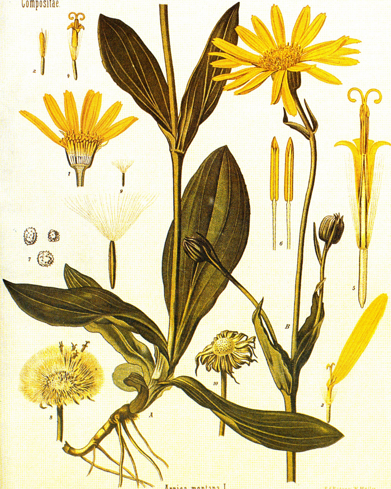
Arnica montana L.